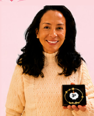
3º SOFIA - No. 6000