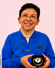
2º ELISA - No. 1948