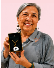
1º LIA - No. 9698

Foram sorteados quatro prêmios, no dia 09/05/2026, e as felizes ganhadoras foram: