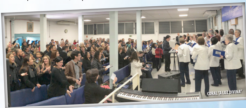
CORAL "A LUZ DIVINA"

O evento contou com a doação de alimentos não perecíveis, doados pelo público e coralistas, totalizando 465 quilos, que foram destinados às obras assistenciais da "A Luz Divina".