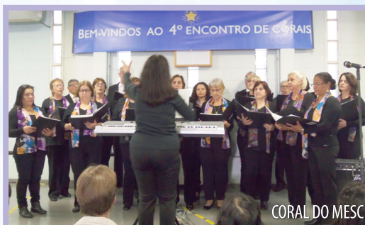
CORAL DO MESC