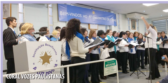
CORAL VOZES PAULISTANAS