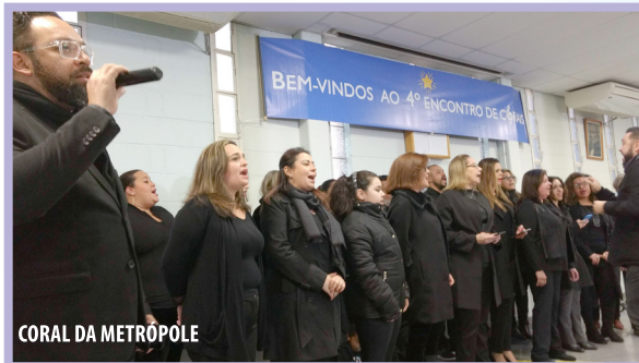
CORAL DA METRÓPOLE