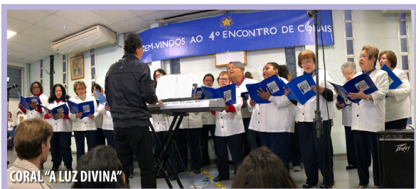
CORAL "A LUZ DIVINA"