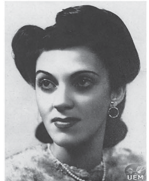
Meimei Livro Diálogo com Deus , de Adésio Alves Machado.

Por mais te aflija a dificuldade, não te confies à tristeza ou ao desânimo. Lembra os órfãos, os doentes, os velhos e os desvalidos da estrada que esperam por teus braços e sorri com serenidade para a luta. Deixa que o trabalho tanja as cordas celestes do teu sentimento para que não falte a música da harmonia aos pedregosos trilhos da existência terrestre. Teu coração é uma estrela encarcerada. Não lhe apagues a luz para que o amor resplandeça sobre as trevas. Eleva-te, elevando-nos. Não te esqueças de que trazes nas mãos a chave da vida porque a chave da vida é a glória de Deus.