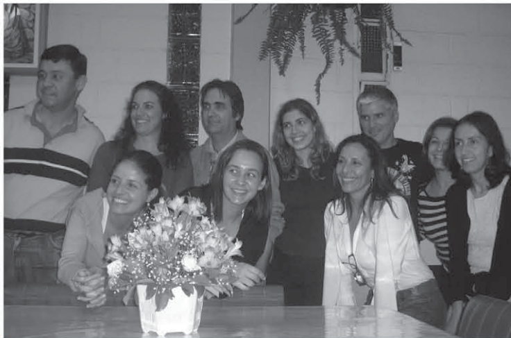
Grupo Irmãos da Luz 24/11/2009