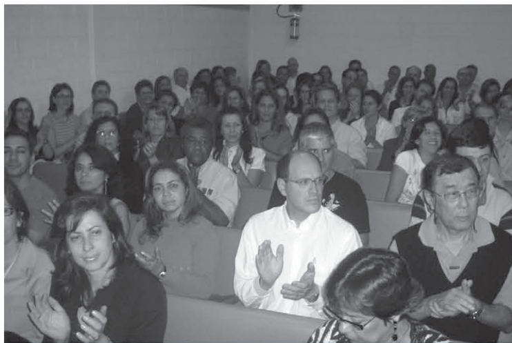
Turma do Noturno 24/11/2009

Nesse momento, os alunos do Básico, 1º e 2º anos, receberam o Certificado de Conclusão do Curso de Aprendizes do Evangelho.