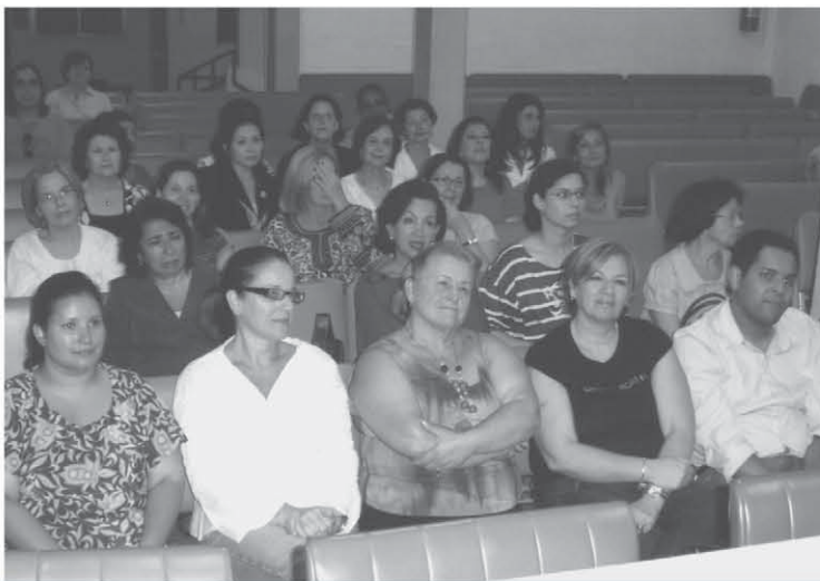
Turma do Vespertino 25/11/2009